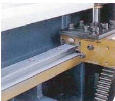
รางเลื่อนและลิเนียร์เบร้ง