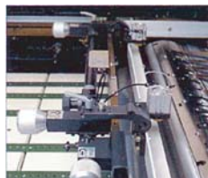
ชุดจับถือคานแม่พิมพ์นิวแมติก และที่ปรับตำแหน่งไมโคร